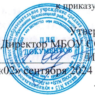
График питания обучающихся в МБОУ СОШ № 15 ст. Переваловской на первое полугодие 2024-2025 учебного года.